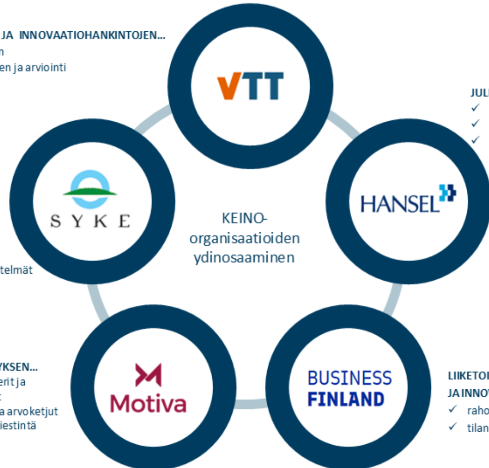
Kuva: KEINO-organisaatioiden ydinosaaminen vuosina 2022–2024