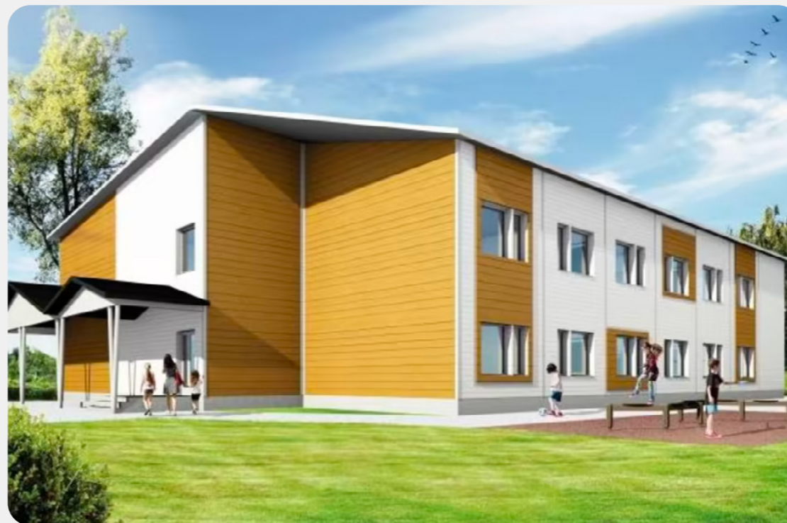
Kärkölän yhtenäiskoulu.

Kustannustieto tuntuu olevan kaikille tärkeä. Paloturvallisuuteen liittyvät asiat.