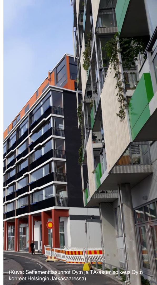
(Kuva: Setlementtiasunnot Oy:n ja TA-asumisoikeus Oy:n kohteet Helsingin Jätkäsaarella)